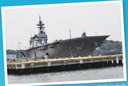
海上自衛隊の特別協力により、横須賀地方総監部の長浦側から正門まで全てのコースの参加者が通り抜けできる