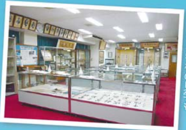
健脚とスタンダードは第2術科学校の見学も